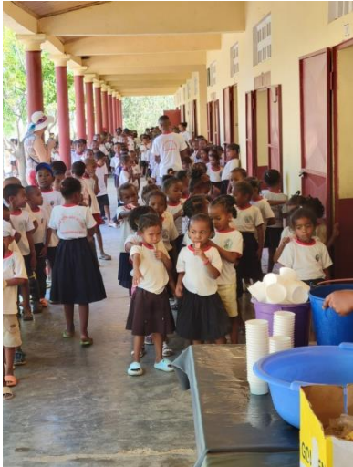
Avant la sieste