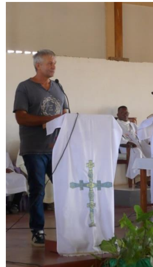
Il faut continuer à travailler, car vous avez de la chance d'aller à l'école. Vous avez votre avenir entre les mains