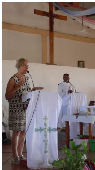
Merci, car les enfants sont bien éduqués et polis