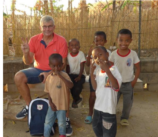
Distribution de bonbons