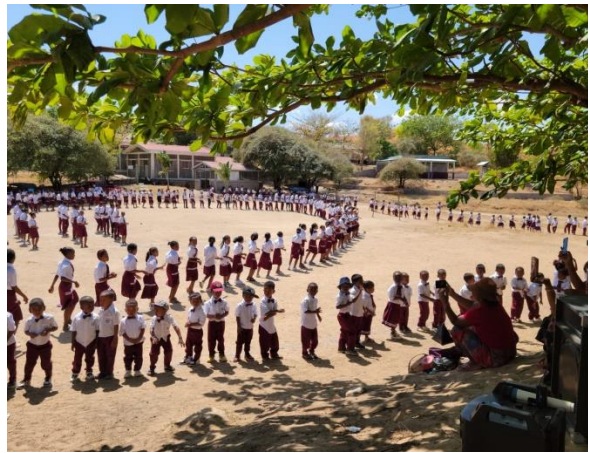
Organisation en forme de cœur pour l'accueil

La matinée s'est poursuivie par l'échange des cadeaux (10 ballons de football, 200 stylos 4 couleurs et des souris d'ordinateur)