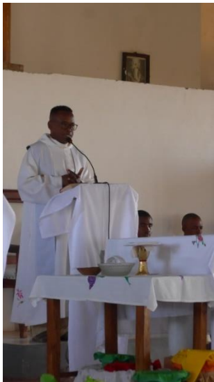
Merci pour tout ce que Groupama fait pour nous et pour les enfants